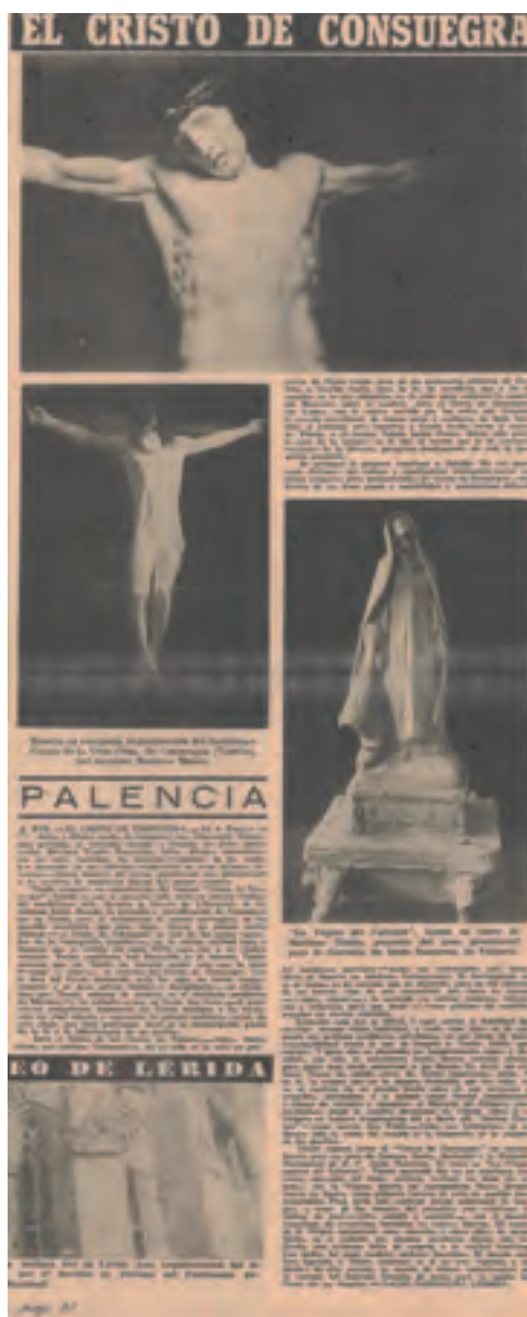
Artículo con la noticia sobre la talla del Cristo de Consuegra. (La Estafeta Literaria nº 10, de 10 de agosto de 1944)

Estudió en la Escuela de Artes y Oficios Artísticos de Madrid, donde obtuvo varios premios en la sección de escultura. En la Exposición Nacional de Bellas Artes de 1926 consiguió la tercera medalla por la obra El hijo pródigo destinada al Museo Nacional de Arte Moderno. Asistió posteriormente a diferentes Exposiciones Nacionales de Bellas artes de los años 1934, 1936, 1948 y 1954, así como a la Exposición Internacional de Padova (Italia) con la obra en bronce Éxtasis de San Antonio de Padua . Ganó el primer premio en la Exposición Nacional del Casino de Clases de Madrid en 1927. Fue merecedor de la beca Conde de Cartagena de la Real Academia de Bellas Artes de San Fernando para ampliación de estudios. Continuó recopilando premios diversos hasta que obtuvo por oposición la plaza de profesor de escultura de la Escuela de Artes Aplicadas y Oficios Artísticos de Palencia en 1936, llegando a ocupar el cargo de director de dicho centro desde el año 1940. Fue Presidente de la Comisión Provincial de