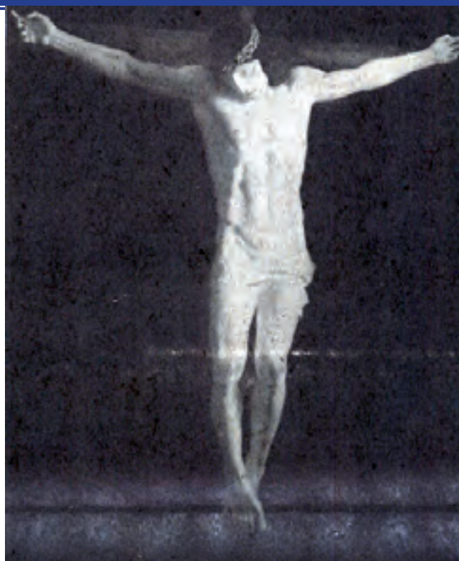
Modelo en escayola, reproducción de la talla del Stmo. Cristo de la Vera Cruz (La Estafeta Literaria nº 10, de 10 de agosto de 1944)